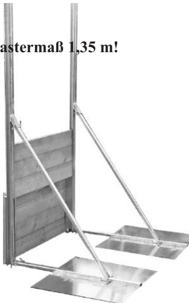
Abb. zeigt 2 Stck. L-Stütze mit Bodenplatte